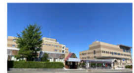
医師の労働時間短縮計画

「C-1水準（臨床・専門研修）」を取得する基幹型臨床病院は、強い健康確保措置が求められています。