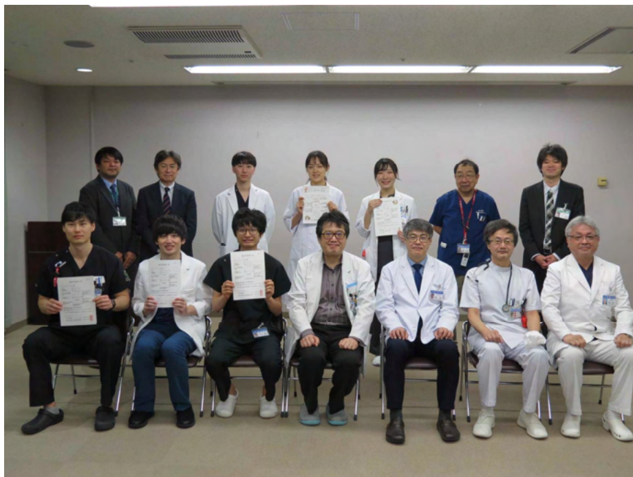
【令和4年度臨床研修修了証授与式で修了者を囲んで】

初期研修のみならず、その後の後期研修、新専門医制度にも広く対応してまいりますので、研修医の皆さんを心からお待ちしております。