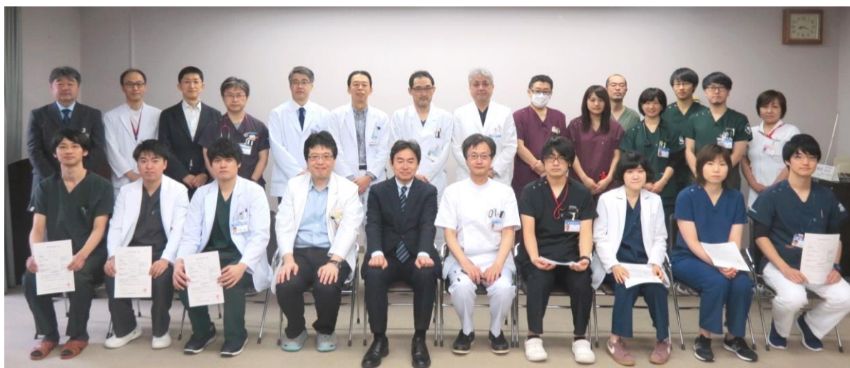
【平成30年度臨床研修修了証授与式で修了者を囲んで】