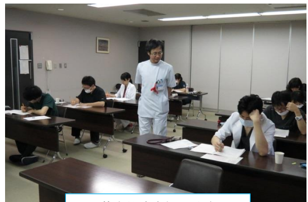
基本的臨床能力試験