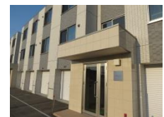
— 研修医宿舎 —