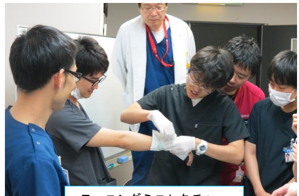
モーニングミニレクチャー