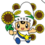
名寄市観光キャラクター 「なよろ」

ちょうどいい田舎にある アットホームな名寄市立 総合病院で初期研修して みませんか？