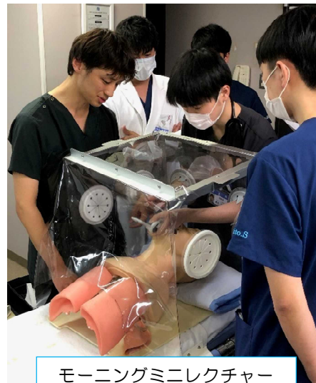
モーニングミニレクチャー