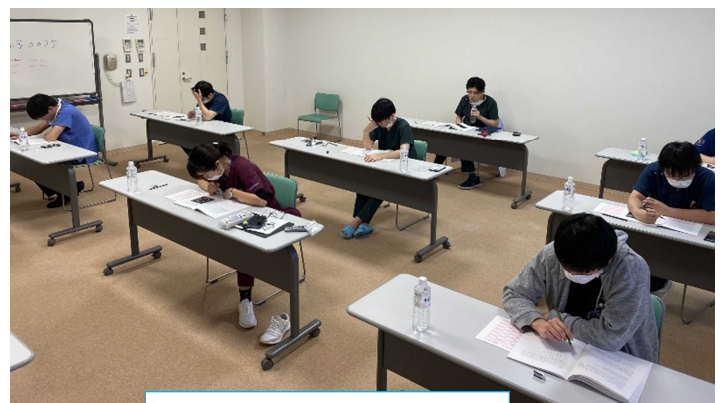
基本的臨床能力試験