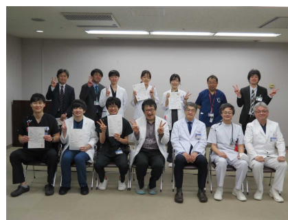
(令和4年度臨床研修修了証授与式)

当院の臨床研修の特徴は、1次～3次救急を取り扱っているため、一般診療で頻りに遭遇する疾患の診断・治療から高度専門医療まで研修できるところにあります。救急は心疾患、脳卒中、多発外傷等について、指導医とともに診療にあたります。地域医療・地域保健は、近隣町村の医療機関、保健所での研修となります。