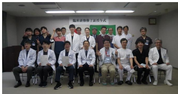
(令和2年度臨床研修修了証授与式)

当院の臨床研修の特徴は、1次～3次救急を取り扱っているため、一般診療で頻りに遭遇する疾患の診断・治療から高度専門医療まで研修できる点にあります。救急は心疾患、脳卒中、多発外傷等について、指導医とともに診療にあたります。地域医療・地域保健は、近隣町村の医療機関、保健所での研修となります。