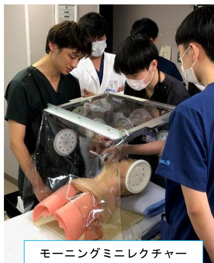
モーニングミニレクチャー