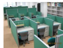
—医局研究室— （研修医用）