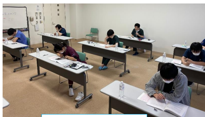
基本的臨床能力試験